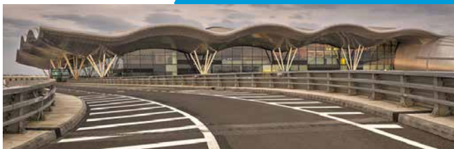
PROJEKT: MEĐUNARODNA ZRAČNA LUKA ZAGREB

Projekte JPP-a ovlaštena su predlagati isključivo javna tijela.