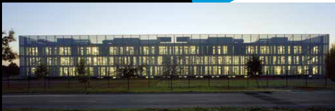
PROJEKT: GIMNAZIJA „FRAN GALOVIĆ“ KOPRIVNICA