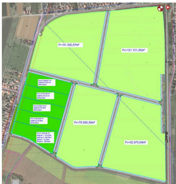
Grafički prikaz prijedloga parcelacije Gospodarske zone Dunav